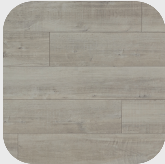
Gala Oak White