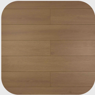
Modern Brown Oak