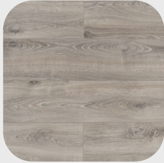
Highland Oak Silver