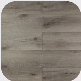
City Grey Oak