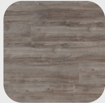
Montmelo Oak Silver