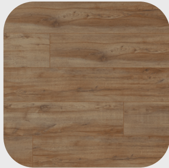
Montmelo Oak Nature