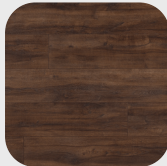
Montmelo Oak Toffee