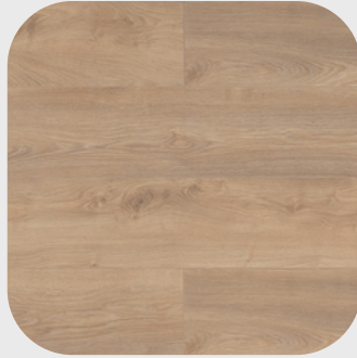
Macro Oak Beige