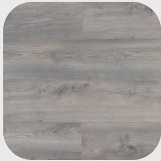
Macro Oak Light Grey