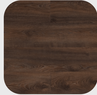
Macro Oak Brown