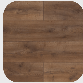
Mountain Oak Brown