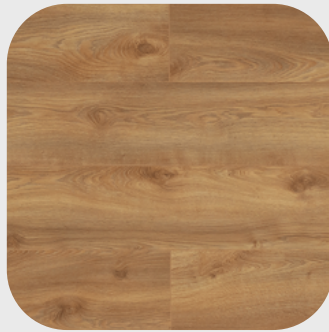
Macro Oak Nature